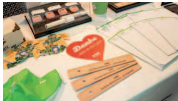
Am Verlagsstand im Foyer konnten Delegierte und Gäste viele Werbemittel des VBE NRW erstellen.